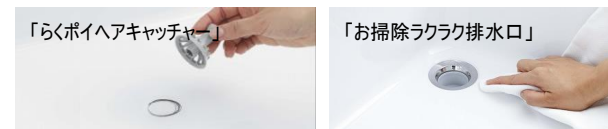
「らくポイヘアキャッチャー」 かんたんにポイと捨てられます。

コーナーの排水口に向かってボウルの底に傾斜をつけました。腕を伝って床にこぼれていた水をしっかりキャッチ。洗顔もゆったり行えます。