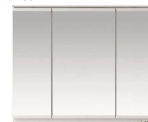
三面鏡(LED照明・エコミラー・全面鏡裏収納付き)