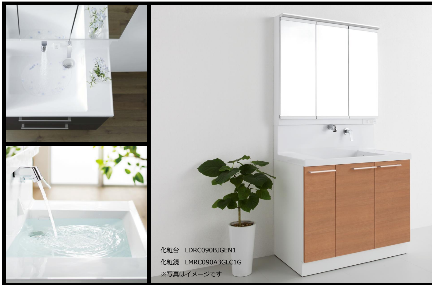
化粧台 LDRC090BJGEN1 化粧鏡 LMRC090A3GLC1G ※写真はイメージです