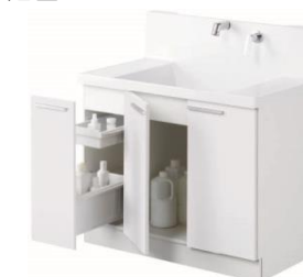
片引き出しタイプ(間口900mm)