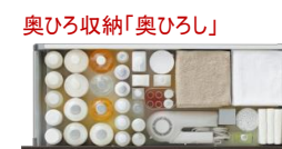
奥ひろ収納「奥ひろし」

排水管を避けていたスペースを収納に活用。収納スペースを約30~50%広くしました。※詳細はカタログをご確認ください。