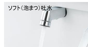
ソフト(泡まつ)吐水

水滴に空気を含ませることで、一粒一粒を大粒化。適度な水量調節により、少ない水でしっかり洗えて節水効果を高めます。