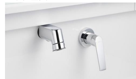
エアインシャワー水栓